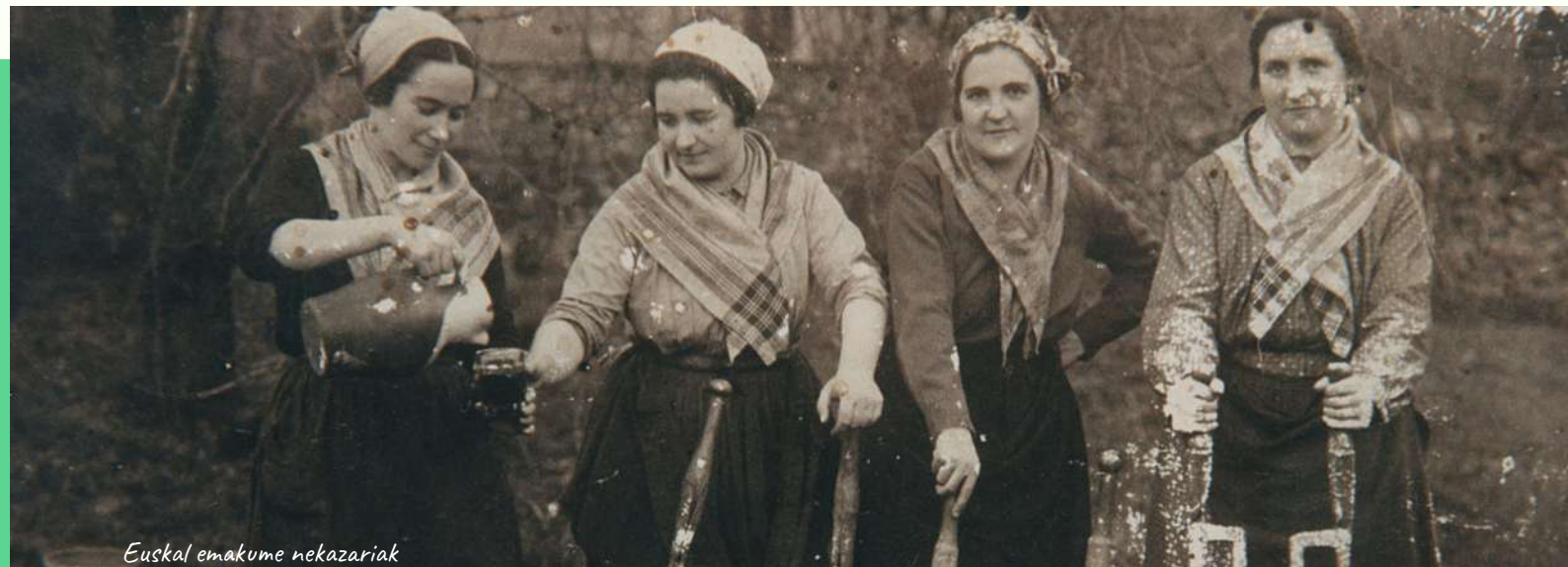
Euskal emakume nekazariak