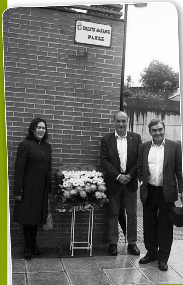
Boliviako enbaxadorea, Gipuzkoako Ahalduen Nagusia eta Azkoitiko alkatea.