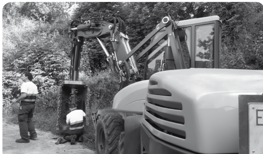
Brigadako langileak, makina berriarekin lanean.

Brigadarako makina berria erosi du Udalak; aparatu berriarekin landa eremuko zein herri guneko lanak azkarrago eta hobeto egitea espero da hemendik aurrera