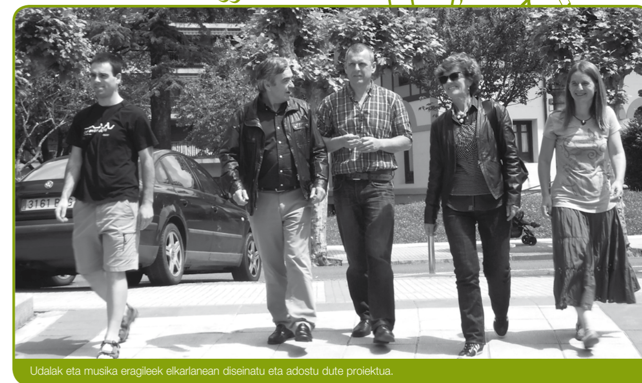
Udalak eta musika eragileek elkarlanean diseinatu eta adostu dute proiektua.

Helburua argia da: musika eskolaren, bandaren eta herriko musika taldeen beharrei irtenbidea ematea. Baina hori baino gehiago ere izan nahi musika gune berriak: Azkoitiko musika eragileen artean sare bat sortu nahi da, euren arteko elkarlana indartzeko. Azken finean, sormen kulturalerako eta elkarlanerako gune bat izango da.