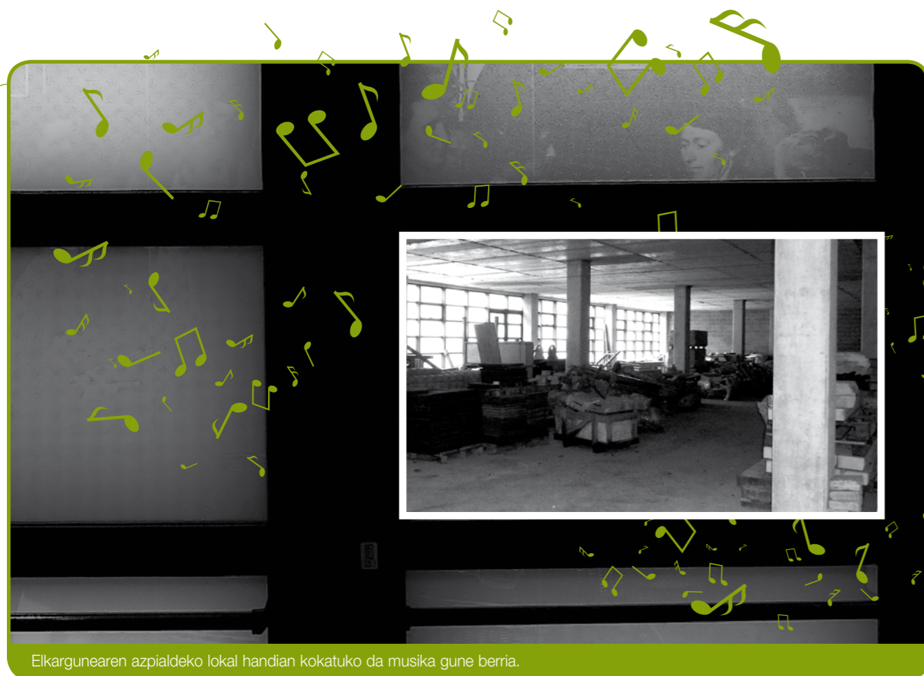
Elkargunearen azpialdeko lokal handian kokatuko da musika gune berria.

Gune berriak 1.000 metro karratu inguruko azalera izango du eta egitura honakoa izango da: Musika eskolak, batetik, bere gelak eta bere gune propioa izango ditu; musika talde ezberdinentzat beste hiru gela intsonorizatuko dira; eta azkenik, hirugarren gune bat egongo da, bai bandakoek, bai musika eskolakoak bai beste musika taldeetako kideek konpartitzeko.