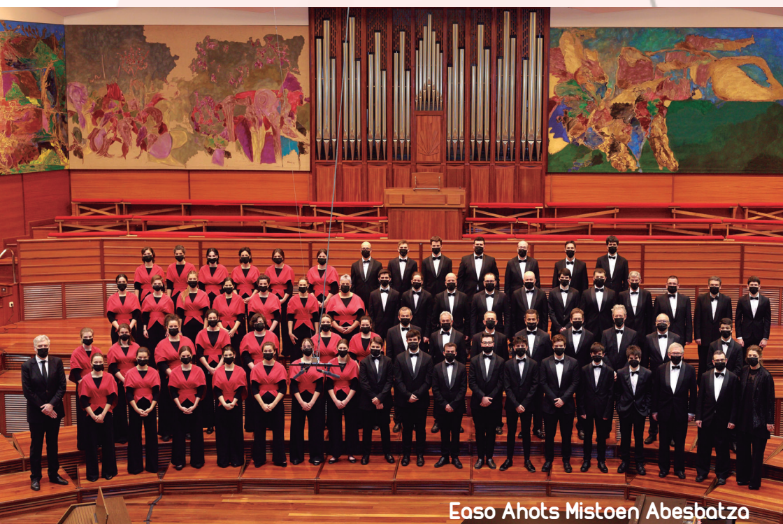
Easo Ahots Mistoen Abesbatza